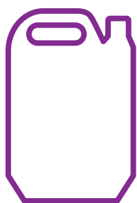
5000ml kanister dosaatorpumbaga